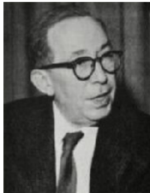
Figuur 1: Leo Strauss (1899 - 1973)

Net als zijn veel bekendere tijdgenoten Hannah Arendt en Eric Voeglin concentreerde het werk van Strauss zich rond de vraag waarom het zo was misgelopen met de liberale democratie in de eerste helft van de twintigste eeuw. Als er in het moderne en ontwikkelde Europa, met al haar glansrijke erfenissen van de Verlichting en de Franse Revolutie miljoenen mensen op een systematische en zelfs geïndustrialiseerde manier de dood vinden, moet er iets grondig mis zijn met de manier waarop men over politiek nadenkt. Strauss zoekt het antwoord op dit vraagstuk door middel van een omvangrijke kritiek op de fundamenten van de moderne samenleving. Hij doet uitgebreid onderzoek naar klassieke teksten van met name Plato en keert terug naar het politiek-theologische probleem, het spanningsveld tussen rede en openbaring. 1