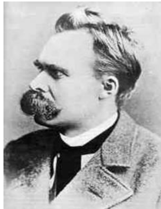
Figuur 2: Friedrich Nietzsche

vormen aan. Bij Nietzsche blijft het geloof in historicisme en veranderlijkheid van de mens bestaan maar raakt het zijn rationaliteit volledig kwijt. De ‘filosoof met de hamer’, zoals Nietzsche wel genoemd wordt, stelt dat alle kennis van goed en kwaad afhankelijk zijn van de historische situatie waarin ze bedacht zijn. Moraal is iets wat bedacht wordt door de personen die op dat moment de macht hebben. Werkelijkheid is niet meer dan een door mensen bedachte constructie, volgend uit de ‘Wil tot Macht’. 13